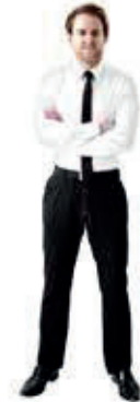
L ab ca. 183 cm

Konstruktiver Aufbau und gewählte Materialien gewährleisten, dass die Anforderungen der Güte & Prüfbestimmungen der RAL-GZ 430 erfüllt werden. Unsere Produkte sind ausgelegt für eine max. statische Belastung von 125 kg pro Sitzeinheit.