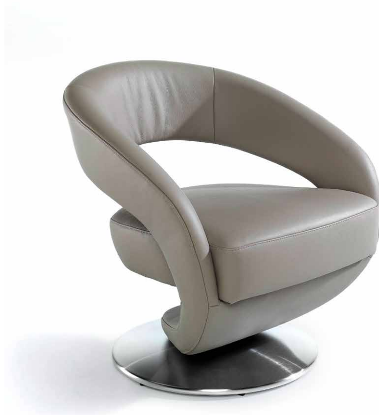
1A Drehsessel mit Drehteller in Edelstahloptik gebürstet